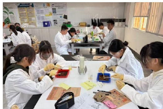
應化系-i 化學 GO GO GO