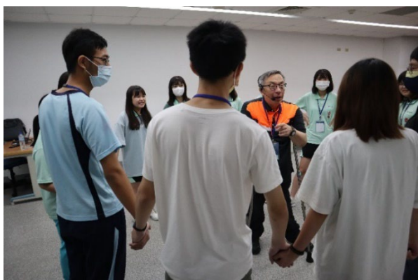
職產處-2023 高中職涯探索扎根活動