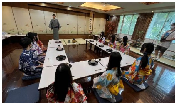
日文系-趣味日語消暑趣