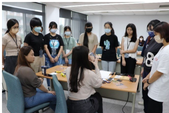
台文系-2023 青春書影：文學夢工廠