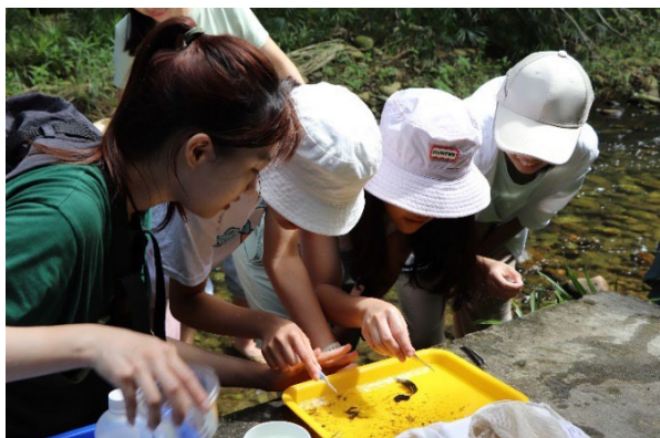
生態系-溼地裡的生態人文