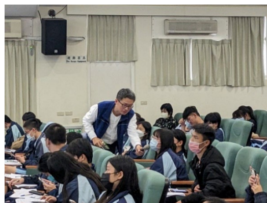
中文系-靈性覺察與人文書畫