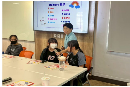
西文系/化科系-西班牙時尚之美x創意化妝品製作計畫